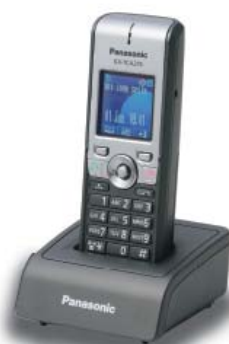
KX-TCA275 kompakt üzleti modell