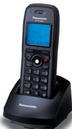
KX-TCA364 masszív modell