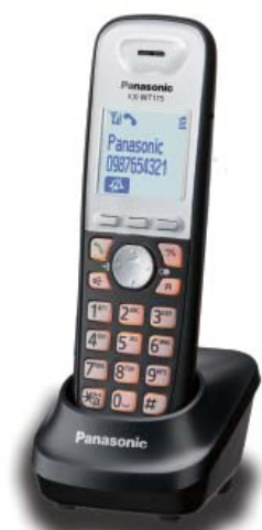
KX-WT115 alapszintű modell