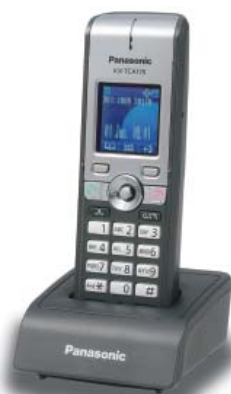
KX-TCA175 normál modell